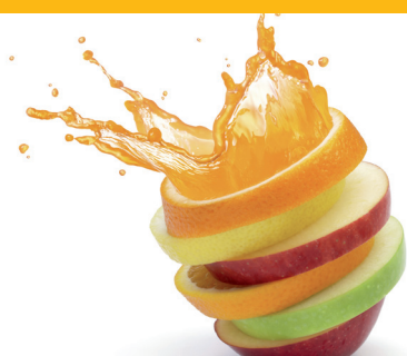
Citron vert Pamplemousse

Pour tous les endroits... restaurants, hôtels, cafés, bureaux, bars, voitures, salles de réunion, salles de sport... fumeurs et non fumeurs en prévention ou pour désodoriser...! Le sable diffuse une note parfumée. Peut être utilisé pour désodoriser agréablement tous les locaux où règnent des mauvaises odeurs: certaines sont communes (odeurs de toilettes, humidité, ou résultant d'une mauvaise aération), d'autres sont spécifiques, permanentes ou instantanées.