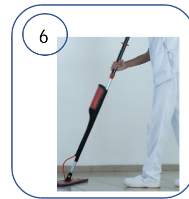
APPLIQUER LA METHODE DE LAVAGE EN HUIT DES LA PERFORATION DE LA POCHE