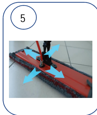
LA FRANGE S'IMPREGNE DE LA SOLUTION PRETE A L'EMPLOI