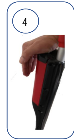
EFFECTUER UNE PRESSION SUR LE CAPOT AFIN DE PERFORER LA POCHE