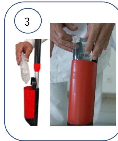
INSERER LE COUSSIN DETERGENT DANS LA CHAMBRE DE PERFORATION