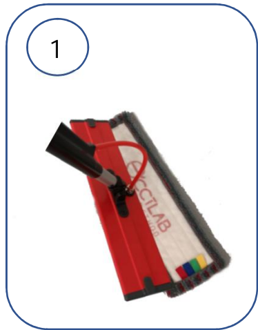
POSITIONNER LA FRANGE AU SOL ET ADAPTER LE M.SYSTEM DESSUS