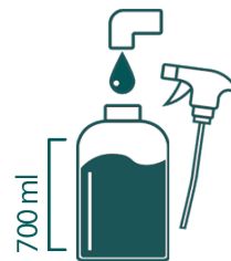
Remplir le flacon avec 700 ml d'eau

L'utilisation de CAPXEL réduit la quantité de déchets, conformément à notre mission d'engagement en faveur de l'environnement.