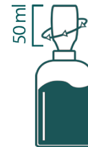
Visser la capsule jusqu'à ce que le produit soit dosé